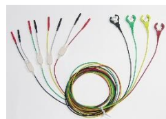
シールド付電極コード

タバコ箱サイズで双極誘導の簡単な心電図計測を行うための携帯型心電図アンプです。精密な心電図検査にはご利用いただけません。RRインターバル(心拍数)の測定などにご利用頂けるものです。